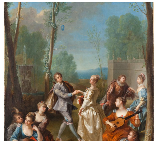
RAOUX Jean, La Danse , 1728, détail ©Musée Fabre 3M