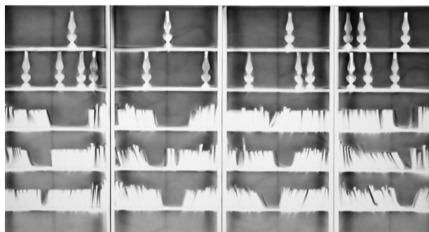
ill 2- Sculptures d'ombre Création de Claudio Parmiggiani en 2002 avant la réhabilitation du lieu pour son intégration au musée Fabre © Musée Fabre / Montpellier Agglomération

Au premier étage se trouvait la bibliothèque, considérablement enrichie par la donation Fabre de 9000 volumes, dont le fonds Vittorio Alfieri, poète italien qu'il avait fréquenté à Florence. La salle de lecture ouvrait sur un cabinet de médailles installé dans le pavillon est. Les murs tapissés de vitrines présentaient de petits objets précieux ayant appartenu à Fabre (certaines de ces œuvres sont présentées dans la vitrine dédiée aux donateurs du musée, salle 12). Dans la salle publique, des escaliers en spirale disposés dans les angles permettaient d'accéder à une galerie en bois placée sur le pourtour de la pièce qui accueillait les ouvrages précieux. Cet aménagement en bois a perduré tout le xx e siècle, jusqu'aux interventions de Georges Rousse et Claudio Parmiggiani en 2002 pendant le chantier de restructuration (ill.2).