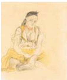
Eugène DELACROIX, Etude de femme juive, 1832 Musée Fabre, Montpellier Agglomération