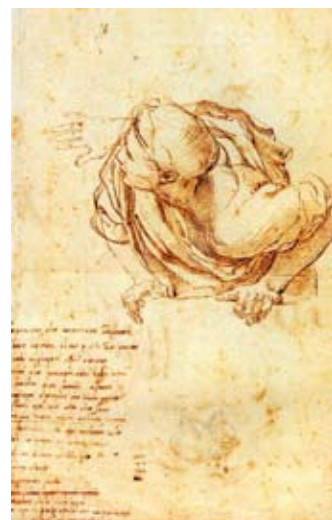
RAPHÄEL, Homme penché en avant, étude pour la Dispute du Saint Sacrement, vers 1508-1511, Musée Fabre, Montpellier Agglomération