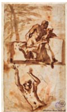
Sebastiano RICCI, Deux études d'homme

Musée Sainte Croix Poitiers, Inv.882.1.135