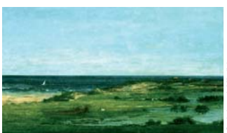
Souvenir des Cabanes (1857) Philadelphia Museum of Art John G. Johnson Collection, 1917

Il donne au ciel, à l'eau, au sable un poids visuel équivalent, saturant le vide par la matérialité de l'acte de peindre, au cœur de la tension entre réalisme et lyrisme pictural.