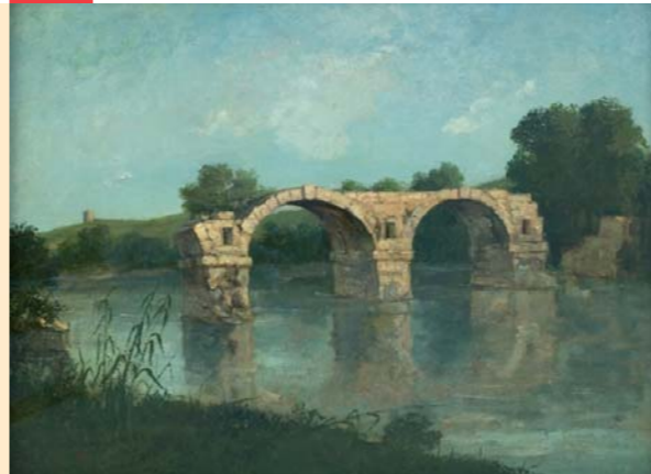
Le Pont d'Ambrussum (1857), musée Fabre, Montpellier

François Sabatier, l'hôte de Courbet à la Tour de Farges, est le commanditaire de ce tableau réalisé en 1857. Lorsque le peintre remarque les restes du vieux pont romain d'Ambrussum (1 er siècle après J.C.), la crue de 1933 n'a pas encore emporté la seconde arche. Dans ce paysage abrupt, Courbet restitue la matérialité de la pierre, semblable aux roches de ses paysages franc-comtois. Le Vidourle remplace ici la Loue, rivière chérie du peintre, dont il s'est plu à peindre le cours accidenté et tumultueux.