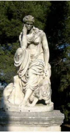
Le sculpteur Marcello, Hécate et Cerbère, Parc de Grammont

Des arts plastiques et visuels au cinéma, de la photographie au spectacle vivant, du livre à la musique ou à la danse en passant par la culture