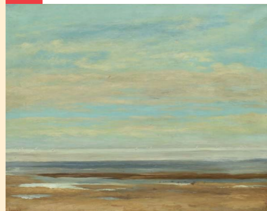
Mer calme (1857), musée Paul Valéry, Sète

Le musée Paul Valéry conserve une marine de Courbet emblématique de sa conception des « paysages de mer », tels qu'il a pu les découvrir lors de ses pérégrinations entre Sète et Villeneuve-lès-Maguelone. La composition, basée sur des variations de couleur, mêle avec génie les souvenirs de la Manche, la révélation de la lumière méditerranéenne et l'intuition de l'espace vide et des horizons infinis.