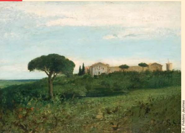
Vue de la Tour de Farges (1857), musée Fabre, Montpellier