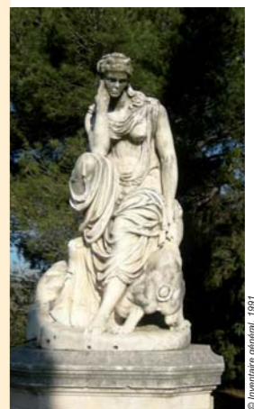
Le sculpteur Marcello, Hécate et Cerbère, Parc de Grammont

Des arts plastiques et visuels au cinéma, de la photographie au spectacle vivant, du livre à la musique ou à la danse en passant par la culture