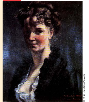
Le sculpteur Marcello (1869), musée des Beaux-Arts de Reims

« Un instant vous fûtes pour moi une des sœurs du Parnasse. Vous m'avez inspiré de la peinture et même de la sculpture », déclare Courbet à la duchesse de Castiglione, auteur de la sculpture d'Hécate et Cerbère sous le pseudonyme de Marcello. Hécate, déesse de la lune, est associée au monde des enfers dont le monstre Cerbère est le gardien. Les deux artistes sont liés par une solide amitié qui ne s'est jamais démentie, y compris pendant et après les dramatiques démêlés que connut Courbet avec le pouvoir lors de la Commune.