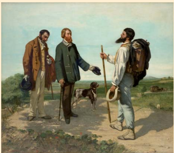
La Rencontre ou Bonjour M. Courbet (1854), musée Fabre, Montpellier

La rencontre entre Gustave Courbet et Alfred Bruyas se situe avant tout sur le terrain allégorique de l'art. Le paysage, anecdotique dans cette représentation et largement recomposé, est néanmoins caractéristique de la campagne héraultaise.