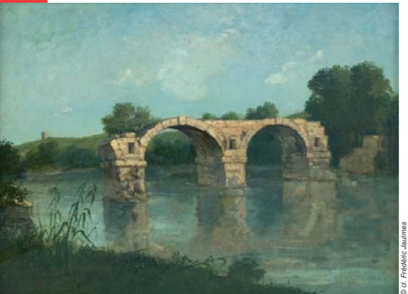
Le Pont d'Ambrussum (1857), musée Fabre, Montpellier

François Sabatier, l'hôte de Courbet à la Tour de Farges, est le commanditaire de ce tableau réalisé en 1857. Lorsque le peintre remarque les restes du vieux pont romain d'Ambrussum (1 er siècle après J.C.), la crue de 1933 n'a pas encore emporté la seconde arche. Dans ce paysage abrupt, Courbet restitue la matérialité de la pierre, semblable aux roches de ses paysages franc-comtois. Le Vidourle remplace ici la Loue, rivière chérie du peintre, dont il s'est plu à peindre le cours accidenté et tumultueux.