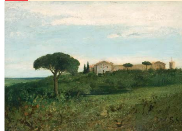
Vue de la Tour de Farges (1857), musée Fabre, Montpellier