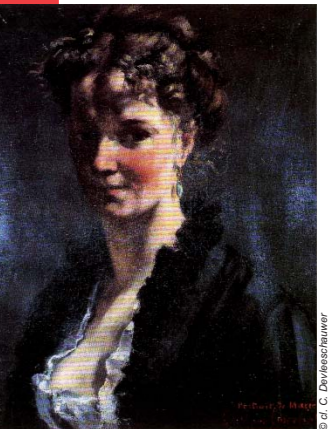
Le sculpteur Marcello (1869), musée des Beaux-Arts de Reims

« Un instant vous fûtes pour moi une des sœurs du Parnasse. Vous m'avez inspiré de la peinture et même de la sculpture », déclare Courbet à la duchesse de Castiglione, auteur de la sculpture d'Hécate et Cerbère sous le pseudonyme de Marcello. Hécate, déesse de la lune, est associée au monde des enfers dont le monstre Cerbère est le gardien. Les deux artistes sont liés par une solide amitié qui ne s'est jamais démentie, y compris pendant et après les dramatiques démêlés que connut Courbet avec le pouvoir lors de la Commune.