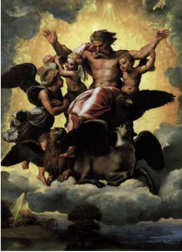
RAPHAËL (Raffaello SANZIO, 1483-1520), La Vision d'Ezéchiel , 1518, huile sur bois, 40x30, Galerie Palatine, Palais Pitti, Florence

Il est indéniable que les cheveux, le visage et la position du corps de Dieu dans ce tableau ont largement influencé Alexandre CABANEL dans la réalisation de La Mort de Moïse .