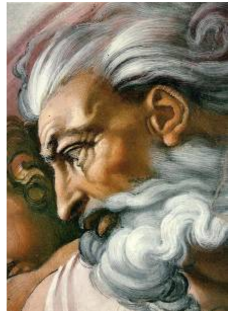
Détail, la Tête de Dieu

MICHEL ANGE (Michel Ange BUONARROTI, 1475-1564), Dieu dans La Création d'Adam , 1510, fresque, 280x570, Plafond de la Chapelle Sixtine, Rome