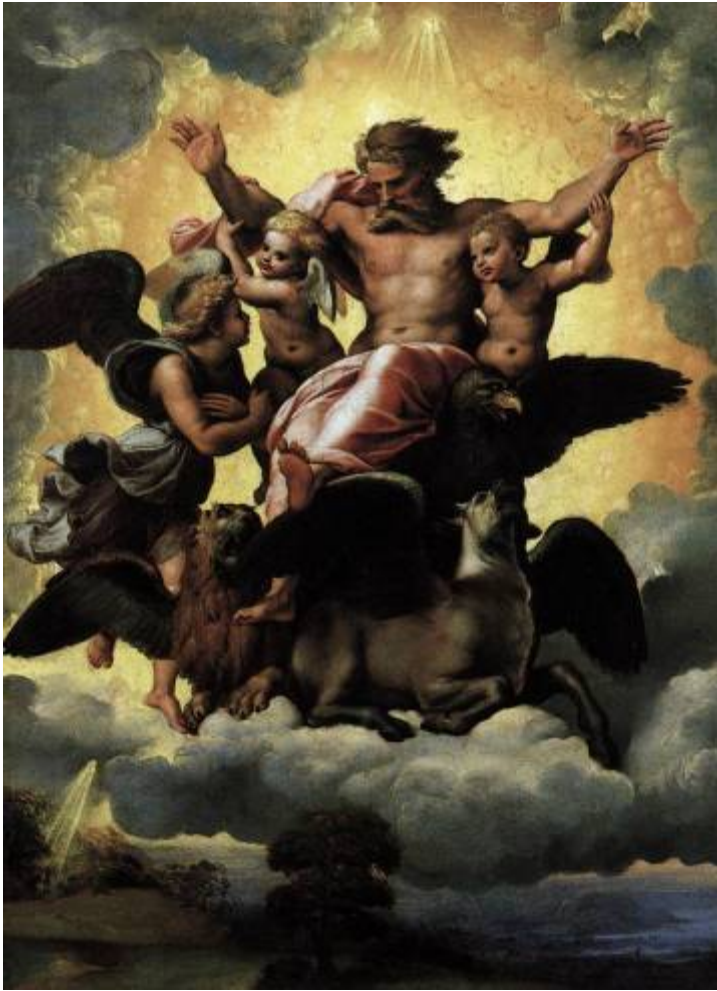
RAPHAËL (Raffaello SANZIO, 1483-1520), La Vision d'Ezéchiel , 1518, huile sur bois, 40x30, Galerie Palatine, Palais Pitti, Florence

Il est indéniable que les cheveux, le visage et la position du corps de Dieu dans ce tableau ont largement influencé Alexandre CABANEL dans la réalisation de La Mort de Moïse .