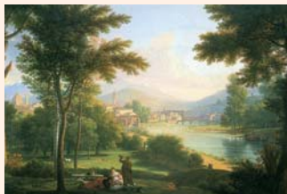
François-Xavier Fabre - Vue de Florence depuis la rive nord de l'Arno (détail)