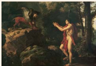
François-Xavier Fabre - Oedipe et le Sphinx