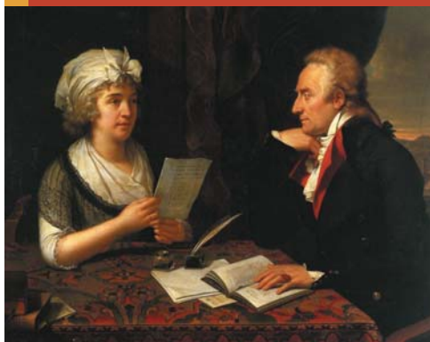
François-Xavier Fabre - Portrait d'Alfieri et de la Comtesse d'Albany dans leur cabinet de travail, 1796