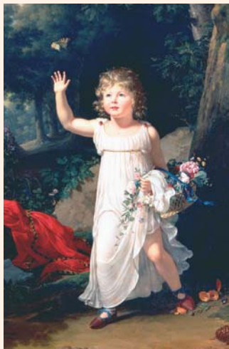
François-Xavier Fabre - Portrait du jeune Edgar Clarke

Cette exceptionnelle rétrospective réunit, pour la première fois, plus de 100 tableaux et autant de dessins de l'artiste dispersés dans des collections prestigieuses à travers le monde entier.