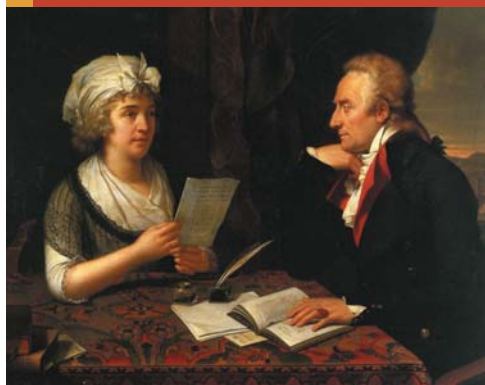
François-Xavier Fabre - Portrait d'Alfieri et de la Comtesse d'Albany dans leur cabinet de travail, 1796