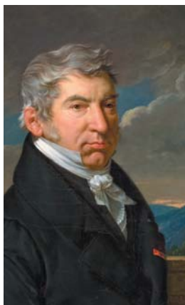
François-Xavier Fabre - Autoportrait âgé, 1835 - Musée Fabre, Montpellier Agglomération

Les vendredis à 11 h : 14/12, 11/01, 08/02 Les samedis à 14 h 30 : 15/12, 12/01, 09/02 Les dimanches à 11 h : 16/12, 13/01, 10/02