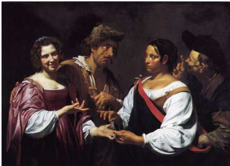
La diseuse de bonne aventure , Simon Vouet , Vers 1620 Huile sur toile ; 1.20 x 1.70 m ; Ottawa, The National Gallery of Canada

Simon Vouet présente ici quatre personnages qui semblent jouer une pièce de théâtre. A gauche, on peut voir une jeune femme vêtue d'une robe élégante (1) témoignant de son milieu aisé et à droite une bohémienne qui lui lit les lignes de la main (2) pour lui prédire l'avenir. Il semble que cette dernière tienne une pièce de monnaie ou qu'elle en profite aussi pour lui dérober sa bague... Deux hommes aux visages très expressifs, à la limite de la caricature, sont postés derrière elles. Celui de droite plonge d'ailleurs sa main dans le sac de la bohémienne (3) , la volant à son tour. La diseuse de bonne aventure ne serait-elle pas prise à son propre piège !?