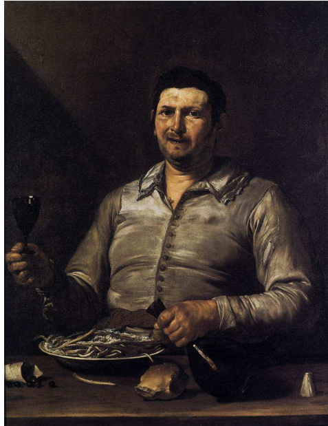
Le Goût , Jusepe de Ribera, vers 1614-1616 Huile sur toile, 1.13 x 0.88 m.

Wadsworth Atheneum Museum of Art, Hartford, CT.