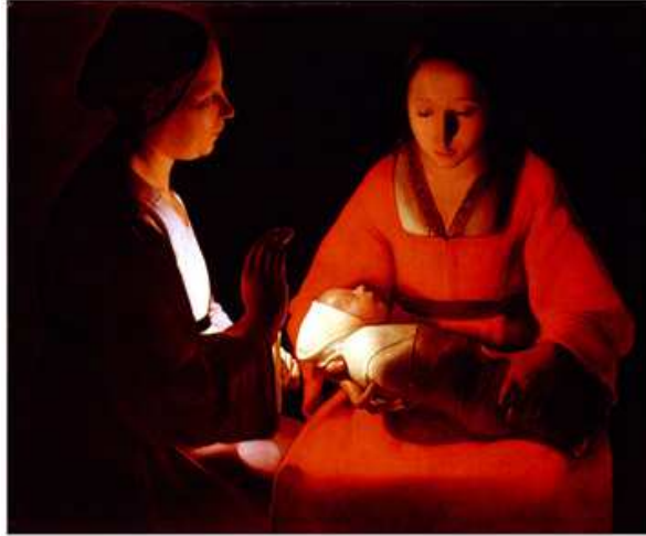
Le Nouveau-né, Georges de La Tour (1593-1652), Huile sur toile. H. 76 ; L. 91 cm Rennes, musée des Beaux-Arts

Un grand sentiment de tendresse et de sérénité émane de ce tableau. Les personnages ne parlent pas, le petit enfant est endormi et les deux femmes le contemplant en silence, elles semblent méditer. Le nouveau-né a été emmaillotté. Il dort paisiblement dans les bras de sa mère (1) qui le serre contre elle avec une grande précaution. Dans la pénombre, seule sa petite tête est éclairée d'une lumière douce et chaude (2) . C'est vers lui que notre regard est attiré en observant le tableau.