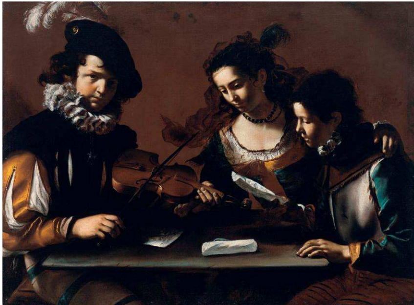
Le Concert, Mattia Preti dit il Cavaliere Calabrese, Vers 1630-1635 Huile sur toile, 1.07 x 1.45 m

Le tableau présente un trio de jeunes musiciens composé de deux chanteurs, une femme et un jeune garçon, accompagnés d'un violoniste. Ils sont réunis pour un concert. La pièce dans laquelle ils sont installés est plongée dans la pénombre et c'est la lumière extérieure qui révèle les personnages et leurs activités. Mattia Preti choisit une composition assez simple où les personnages sont représentés en frise, tous au même niveau, autour d'une table. Les chanteurs sont absorbés dans la lecture de la partition (1) .