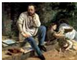
Pierre-Joseph Proudhon et ses enfants en 1853, 1865-1867, Paris