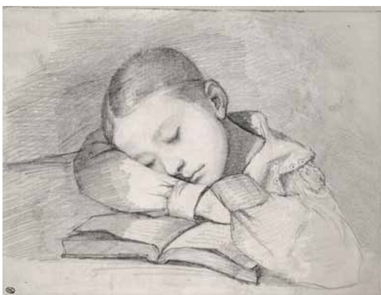
Juliette Courbet, vers 1840, Paris, musée d'Orsay conservé au départe- ment des Arts graphiques du musée du Louvre, RF 29234

goût pour sa région natale et les paysages aux caractéristiques géologiques singulières autour d'Ornans.