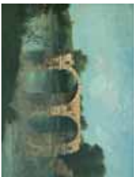
Villetelle Pont d'Ambrussum (1854), Musée Fabre, Montpellier.