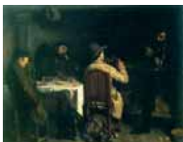
Une après-dinée à Ornans, 1848-1849