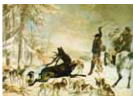
L'Hallali du cerf, 1867, © Besançon, musée des Beaux-Arts et d'archéologie (photo Pierre GUENAT)