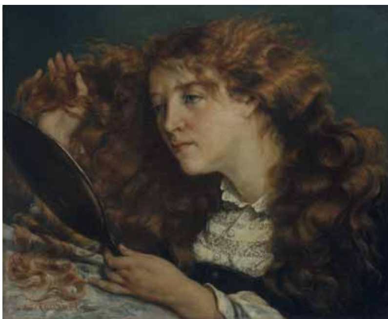
Jo, la belle Irlandaise 1866 Huile sur toile, 0,54x0,65 m The Metropolitan Museum of Art, New York, 29.100.63

L'exécution de cette œuvre coïncide avec le départ de Whistler pour le Chili, suscitant des rumeurs sur une possible liaison entre Courbet et son modèle.