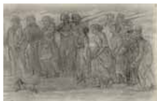
Carnet de dessins, F° 11 : cortège d'hommes et de femmes conduits par quatre soldats, vers 1870-1871, Paris, musée d'Orsay conservé au département des Arts graphiques du musée du Louvre, RF 29234