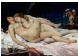
Le Sommeil, 1866, Paris, © Petit Palais / Roger Violet