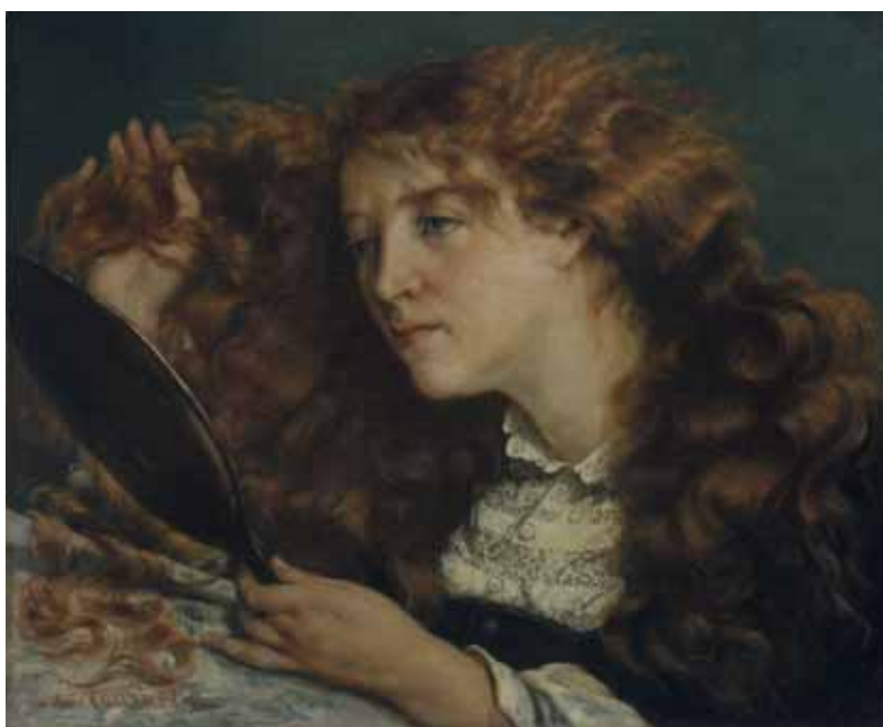
Jo, la belle Irlandaise 1866 Huile sur toile, 0,54x0,65 m The Metropolitan Museum of Art, New York, 29.100.63

L'exécution de cette œuvre coïncide avec le départ de Whistler pour le Chili, suscitant des rumeurs sur une possible liaison entre Courbet et son modèle.