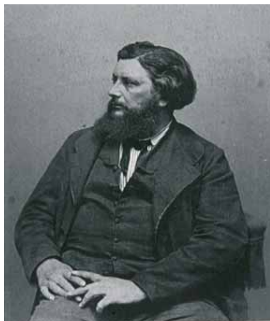
Etienne Carjat, Gustave Courbet, 1861, épreuve photomécanique de Jules Marie d'après la photographie de Carjat, Paris, musée d'Orsay, PHO 1983 40

- Gaspard-Félix Tournachon dit Nadar (Paris, 1820-Paris, 1910), photographe de l'élite intellectuelle parisienne des années 1840/1850 dont les portraits de Beaudelaire, Berlioz, Champfleury, Journet ;