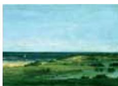
Souvenirs des Cabanes, Philadelphie, Museum of Art, © John G. Johnson Collection, 1917