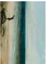
Villeneuve-les-Maguelone, Le Bord de la mer à Palavas (1854), Musée Fabre, Montpellier.