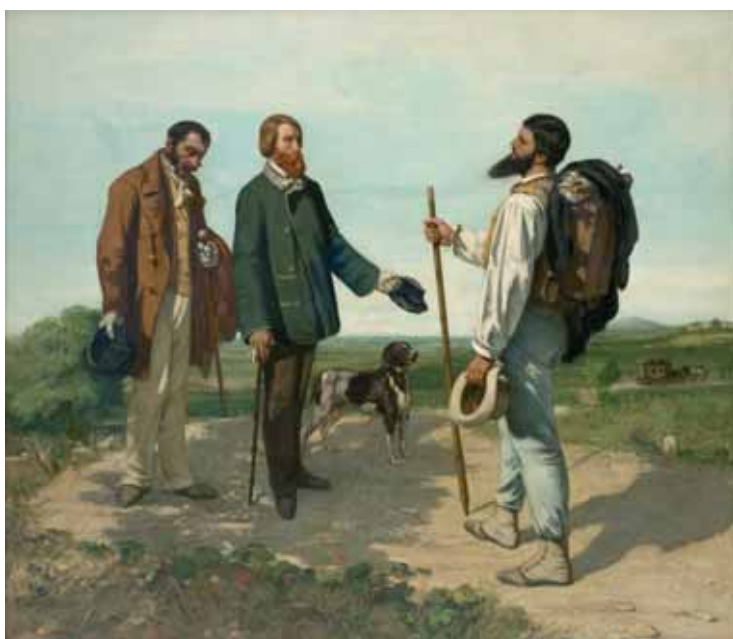
La Rencontre ou Bonjour Monsieur Courbet 1854 Huile sur toile, 1,32x1,50 m Musée Fabre de Montpellier Agglomération, 868.1.23

bâton de pèlerin à la main. Il célèbre ainsi la liberté de l'artiste voyageur indépendant et la mission supérieure dont il se sent investi, la défense du réalisme. Face à lui l'élégant Bruyas accompagné de son valet illustre parfaitement le grand bourgeois de province accueillant l'artiste d'une révérence. Le tableau incarne ainsi le lien qui unit les deux hommes : Bruyas a besoin du peintre dont il admire les qualités pour réaliser les œuvres qu'il a en projet, Courbet a besoin du soutien financier et amical du collectionneur, homme de goût fortuné. « J'ai raison, j'ai raison ! Je vous ai rencontré. C'était inévitable, car ce ne sont pas nous qui nous sommes rencontrés, ce sont nos solutions » dira Courbet dans une de ses lettres à son ami, annonçant le programme de l'œuvre. Jalon incontournable de la peinture française du XIX e siècle, La Rencontre ouvre la voie de l'impressionnisme grâce à sa palette claire et colorée. Sa modernité réside également dans l'élévation d'un fait divers, intime, au rang de la peinture historique, poursuivant ainsi le travail de renversement des hiérarchies établies commencé avec l'Après-dînée à Ornans .