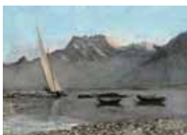
La Dent du Midi, (depuis Bosset), 1874, Collection particulière

10-12 – Salles des photographies : Ces photographies offrent un saisissant parallèle avec les œuvres de Courbet dans leur nouvelle approche du réel et leur connaissance intime des sujets.