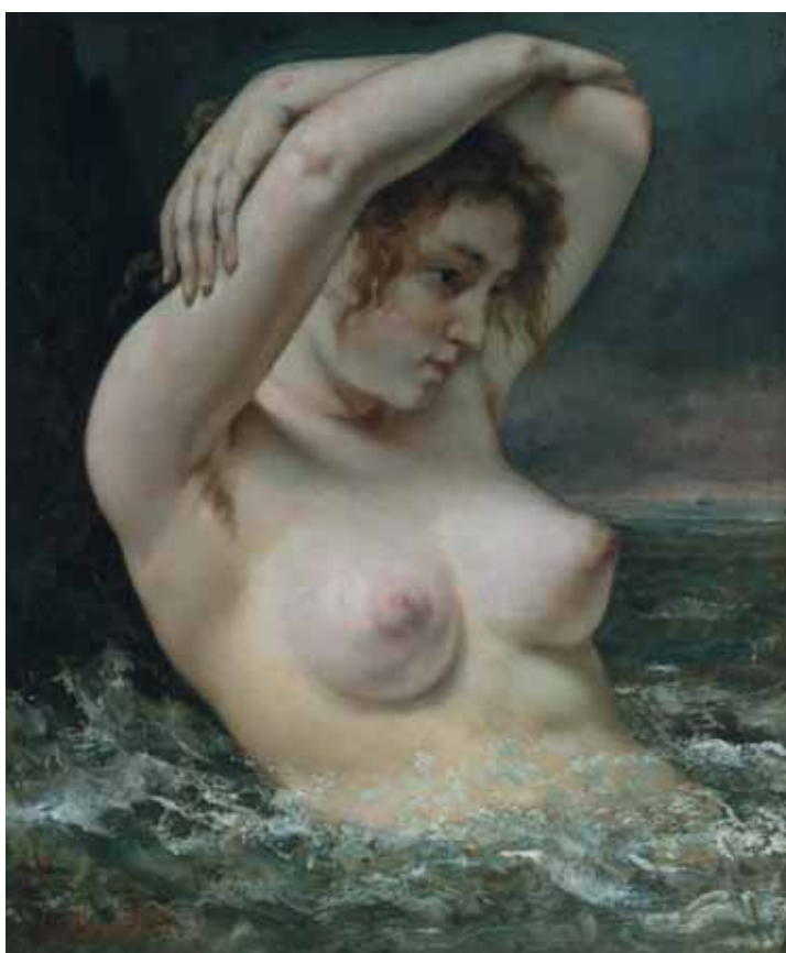
La Femme à la vague 1868 Huile sur toile, 0,65x0,54 m The Metropolitan Museum of Art, New York, 29.100.62

des mains n'évoquent pas la volonté de se cacher mais au contraire l'affirmation de sa beauté et l'invitation aux regards auxquels elle semble indifférente. Ce nu, un des plus sensuels du peintre, met en valeur les charmes du modèle grâce à la richesse de la matière picturale et le choix subtil des couleurs. La chair rose et blonde appelle la caresse, les tétons, d'un rose tout aussi délicat, pointent au dessus des seins lourds et fermes dont la fine peau laisse apercevoir le réseau bleuté et délicat des veines. Auguste Renoir et Edouard Manet seront marqués par cette volupté des nus de Courbet. Le peintre reste néanmoins fidèle à lui-même en représentant la femme sans apprêt : ses cheveux bruns dénoués encadrent son visage tandis que ses aisselles dévoilent des poils soulignant le refus de se soumettre aux conventions académiques d'un nu idéal et lisse. Malgré l'irréalisme de la pose qui semble faire reposer la femme sur l'eau, le modèle s'inscrit bien dans la réalité de son temps.