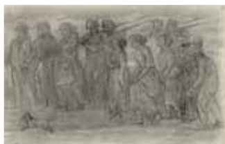
Carnet de dessins, F° 11 : cortège d'hommes et de femmes conduits par quatre soldats, vers 1870-1871, Paris, musée d'Orsay conservé au département des Arts graphiques du musée du Louvre, RF 29234