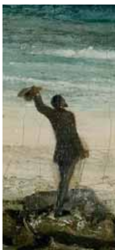
Le Bord de mer à Palavas (détail) 1854

Comme Bruyas l'avait fait en 1854, le musée Fabre a tout mis en œuvre pour accueillir le retour de Gustave Courbet à Montpellier. L'installation de ses toiles bouleverse l'accrochage des collections permanentes puisque les 1000 m 2 de la salle d'exposition ne suffisent pas à présenter les 116 œuvres de Gustave Courbet et la quarantaine de photographies. Cinq salles sont donc annexées au profit de cet artiste incontournable pour présenter au public l'ensemble de son travail à travers 16 sections. Placé au cœur d'un parcours organisé chronologiquement autour des thèmes et des lieux chers à l'artiste, le fonds du musée Fabre se prolonge et s'enrichit dans tous les rapprochements possibles créés par la réunion exceptionnelle de la centaine de tableaux pour la saison.