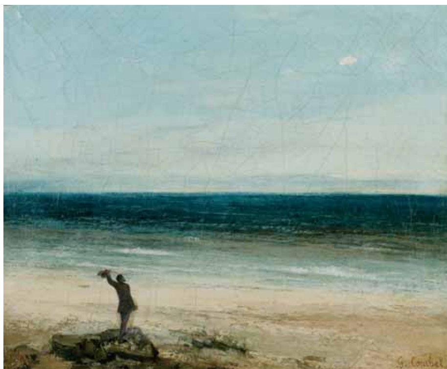
Le Bord de mer à Palavas 1854 Huile sur toile, 0,37x0,46 m Musée Fabre de Montpellier Agglomération, 868.1.24

identifiée puisqu'il pourrait s'agir aussi bien du peintre lui-même que de Bruyas. Quoi qu'il en soit, il lui est souvent associée une phrase de Courbet adressée à Jules Vallès : « O, mer ! Ta voix est formidable, mais elle ne parviendra pas à couvrir celle de la Renommée criant mon nom au monde entier ». Ce personnage donne toute sa force au tableau en décuplant la sensation d'immensité malgré ses modestes dimensions. Le paysage s'étage en trois bandes quasi abstraites de couleurs superposées : ocre pour la plage, vert bleu pour l'onde, bleu délavé pour le ciel. Sans artifices, l'artiste nous livre ainsi une véritable communion avec les éléments, une rencontre euphorique avec la nature qui inspirera Whistler quand il retrouve Courbet à Trouville dix ans plus tard. Le Bord de mer à Palavas annonce d'ailleurs toute la série