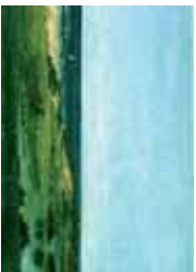
Souvenir des cabanes (1854), Philadelphia Museum of Art