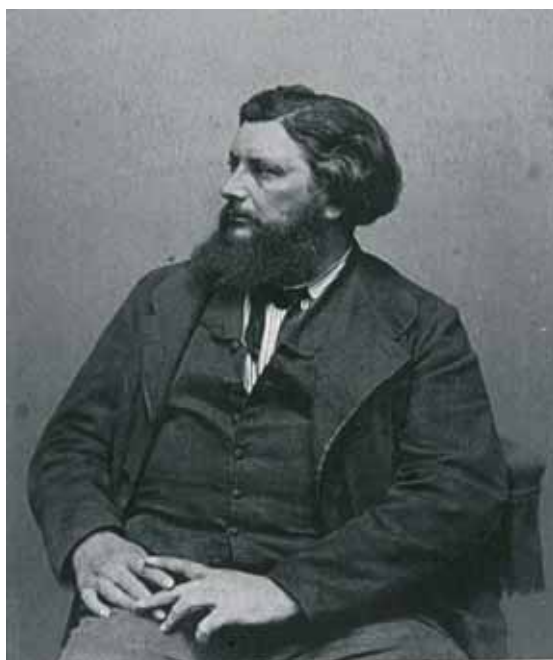
Etienne Carjat, Gustave Courbet, 1861, épreuve photomécanique de Jules Marie d'après la photographie de Carjat, Paris, musée d'Orsay, PHO 1983 40

- Gaspard-Félix Tournachon dit Nadar (Paris, 1820-Paris, 1910), photographe de l'élite intellectuelle parisienne des années 1840/1850 dont les portraits de Beaudelaire, Berlioz, Champfleury, Journet ;