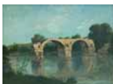
Le Pont d'Ambrussum, 1854, © Musée Fabre-Montpellier Agglomération cliché Frédéric Jaulmes