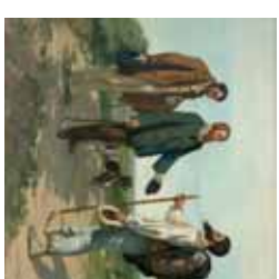
Mireval, Vic-la-Gardirole La Rencontre ou Bonjour Monsieur Courbet (1854), Musée Fabre, Montpellier