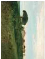
Lunel-Viel Vue de la Tour de Farques (1854), Musée Fabre, Montpellier.