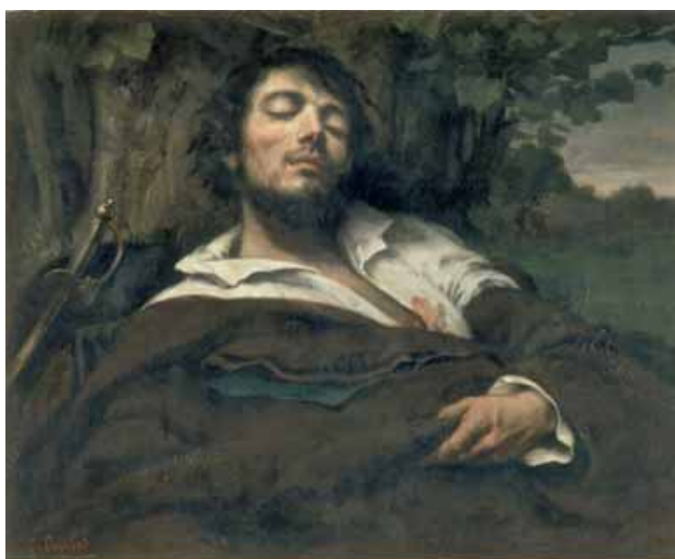
Portrait de l'artiste dit L'homme blessé 1844-1854

Huile sur toile, 0,81x0,97 m Musée d'Orsay à Paris, RF 338