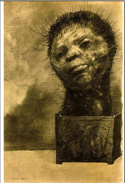
L'Homme-cactus , 1881

Odilon REDON était très intéressé par les découvertes scientifiques, il publie le livre de lithographies Les origines en 1883. Il est persuadé que les formes des animaux évoluent progressivement pour s'adapter à leurs conditions de vie qui évoluent aussi 1 . Dans cet ouvrage, REDON réfléchit sur la question de nos origines : « D'où venons-nous ? Où allons-nous ? » C'est une référence à Charles DARWIN 2 qui a publié en 1859 L'origine des espèces (De l'origine des espèces au moyen de la sélection naturelle, ou la préservation des races favorisées dans la lutte pour la vie) . Cet artiste a visité le Musée d'Histoire Naturelle de Paris, il appartenait à un cercle scientifique de Bordeaux et était ami de Louis PASTEUR (1822-1895) à qui il a offert un exemplaire du livre Les origines .