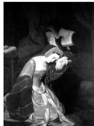
ill.3- Edouard Cibot Anne Boleyn à la tour de Londres , 1835 Autun, Musée Rolin