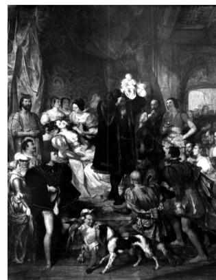
ill.2- Eugène Devéria La naissance d'Henri IV Paris, Musée du Louvre

Granet* (1775-1849) offre avec L'intérieur d'une église souterraine* un style troubadour plus pittoresque et anecdotique où vibrent cependant avec un clair-obscur inquiétant et le caractère morbide de la scène les accents du romantisme. Préfigurant le Michel-Ange dans son atelier* de Delacroix (salle 32), il dépeint avec Montaigne visitant le Tasse* la figure saturnienne du grand poète en proie au doute de la création dans un face à face avec le philosophe humaniste.