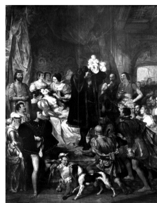
ill.2- Eugène Devéria La naissance d'Henri IV Paris, Musée du Louvre

Granet* (1775-1849) offre avec L'intérieur d'une église souterraine* un style troubadour plus pittoresque et anecdotique où vibrent cependant avec un clair-obscur inquiétant et le caractère morbide de la scène les accents du romantisme. Préfigurant le Michel-Ange dans son atelier* de Delacroix (salle 32), il dépeint avec Montaigne visitant le Tasse* la figure saturnienne du grand poète en proie au doute de la création dans un face à face avec le philosophe humaniste.