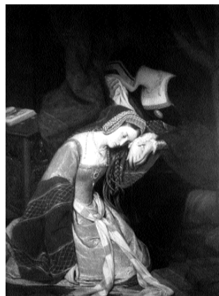
ill.3- Edouard Cibot Anne Boleyn à la tour de Londres , 1835 Autun, Musée Rolin