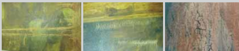
Perte de matière le long de la pliure