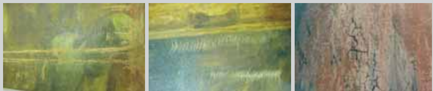
Perte de matière le long de la pliure

Avant toute intervention, l'œuvre à restaurer est examinée soigneusement. À partir de ces observations, il est souvent possible de reconstituer l'histoire matérielle d'une œuvre : pour le tableau de BEROUD, les observations permettent de conclure que la toile a certainement été rétrécie et a subi une inondation. Lorsqu'elle n'était pas exposée, l'œuvre était conservée pliée en deux ce qui a causé une déformation du support. La couche picturale de l'œuvre présente une bonne cohésion. Cependant, la mauvaise tension de la toile et des coulures d'eau, ont provoqué des pertes de matière picturale. De nombreuses lacunes en arête de poisson consécutives à un ancien roulage sont visibles. Les zones fragilisées ont été protégées par la pose préventive de papier japon.