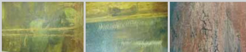
Perte de matière le long de la pliure