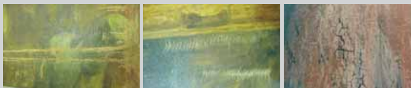
Perte de matière le long de la pliure