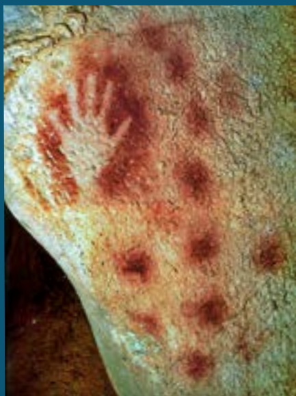
Grotte du Pech-Marle (département du Lot), main dite « négative », dont la forme du dessin est créé à partir de « crachis » de pigment.

« Je vous le confirme. J'ai un rapport très intime avec la Préhistoire. Étudiant, j'ai lu les écrits de l'abbé Breuil 5 , « Pape de la Préhistoire », associé à Pierre Teilhard de Chardin 6 , paléontologue théologien et philosophe, que j'ai aussi découvert pour d'autres raisons. Lors de ses tournées, Henri Breuil dessine beaucoup dans les cavernes aux fins de relevés pariétaux ; je découvre alors à travers son travail le monde mystérieux et grandiose de nombreux sites ornés. Il se préoccupe également de l'industrie lithique et du classement des outils, ce qui m'intéresse et m'inspire particulièrement dans l'élaboration de nombreux types d'« outils » comme celui du Couple toile-outil et d'autres plus autonomes par la suite. Visiter une grotte préhistorique est un moment d'intense concentration en contemplant l'art pariétal face au temps géologique dans lequel il se situe. Je suis face à une économie de moyens graphiques et picturaux d'une grande exemplarité. Dans mes différentes randonnées in situ, la présence de la Préhistoire est indissociable de mes actions face aux subjectiles que j'affranchis et dont les diverses empreintes produites par le gel thermique et la suie me renvoient régulièrement au charbon de bois utilisé par les artistes chasseurs-cueilleurs. Je vis l'espace et l'histoire du lieu comme des générateurs de forces inventives où l'improvisation du traçage généré par la poussière carbonée de la combustion s'inspire du fait préhistorique ».