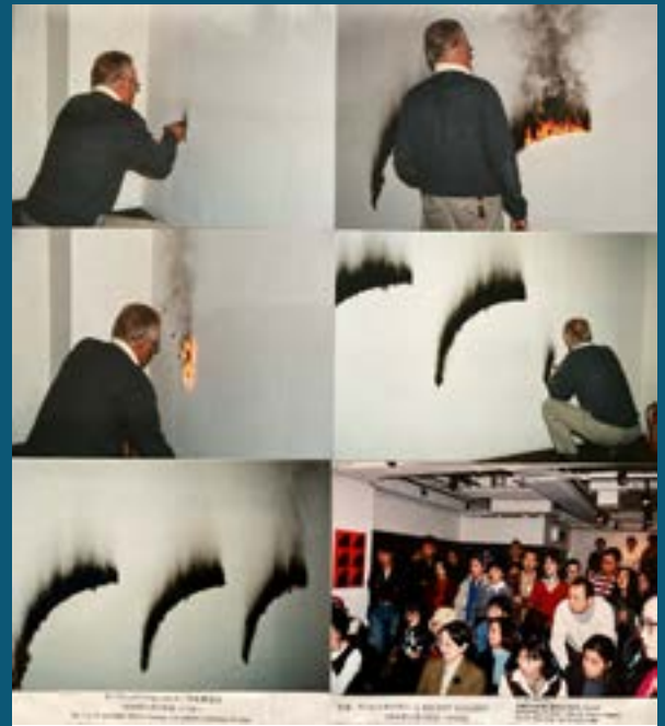
Christian Jaccard, Tableau éphémère , 1994, Recent Gallery, Sapporo.

EXPLOITATION : Les élèves retrouvent les formes géométriques formées par leurs camarades. Une sensibilisation aux produits du quotidien et leurs dangers, que ce soit dans les mélanges ou les combustions.